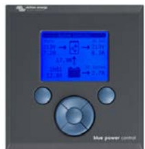
Tableau de commande Blue Power

Une solution pratique et bon marché pour une surveillance à distance, avec un bouton rotatif pour configurer les niveaux de Power Control et Power Assist.