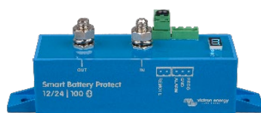
Smart BatteryProtect BP-100