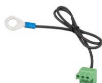
Connecteur avec un câble négatif CC préassemblé (inclus)