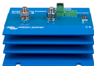
Smart BatteryProtect BP-220