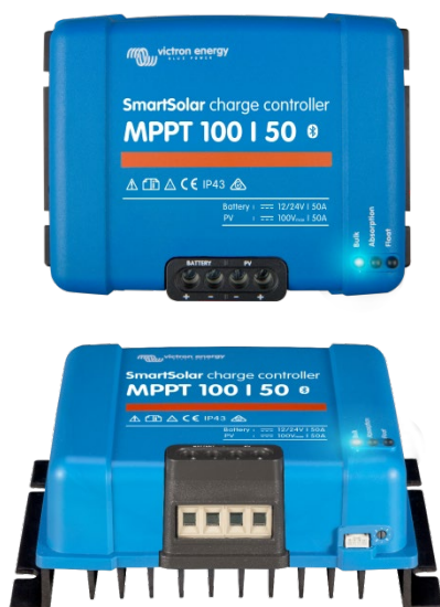
Contrôleur de charge SmartSolar MPPT 100/50

- Color Control GX et d'autres produits GX.